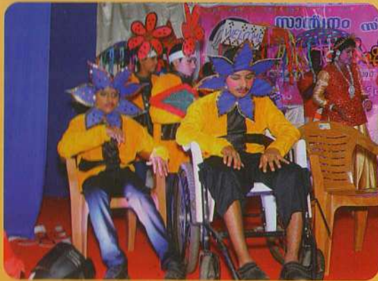
From the Opening Dance