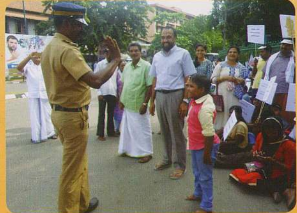
എനിക്കും സല്പൂട്ട് അറിയാം - ആദി