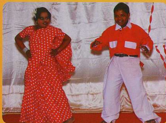
അമ്മല - അമ്മൽ