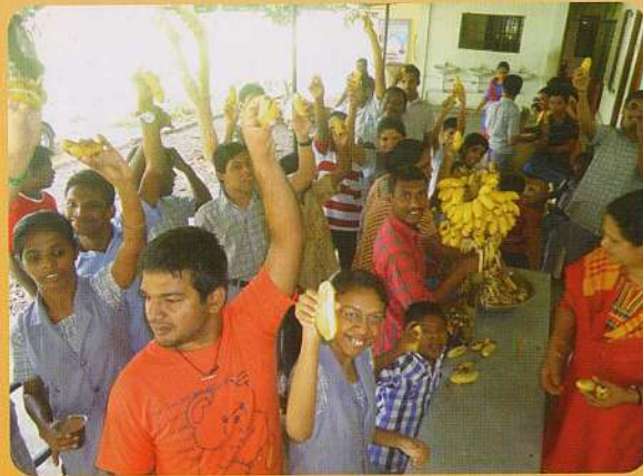
ഹായ് പുവൻ പഴം ! സ്വന്തം കൃഷി