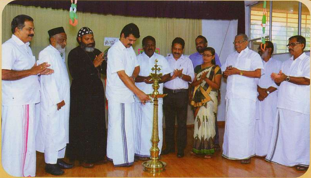
പുതിയ പാഠ്യ പദ്ധതി ഉദ്ഘാടനം - ജോയ്സ് ജോർജ്ജ് എം.പി.