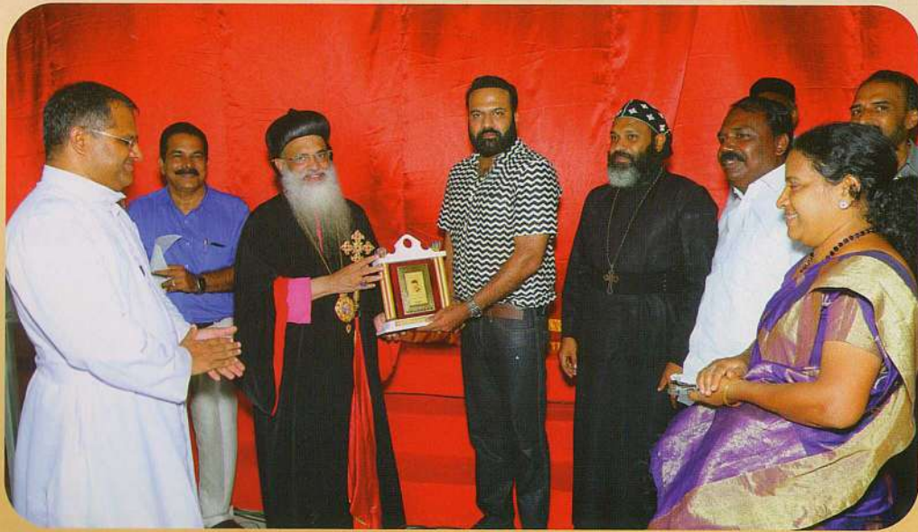
വന്യ റോയി കണ്ണച്ചിറ അച്ചനും പ്രിയപ്പെട്ട ടിനി ടോമിനും ആദരവ്