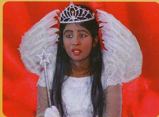
ഒരു സാന്ത്വനം മാലാഖ