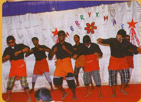
ഹാ ! കൗതുകം ! സാന്ത്വനം നർത്തകർ